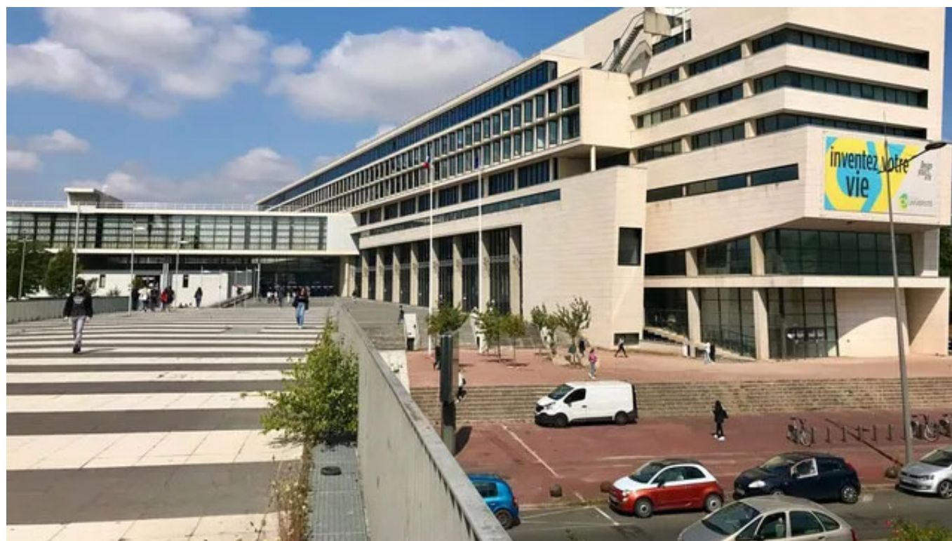
CY Transfer vient d'être labellisé Pôle universitaire d'Innovation (PUI) (CC BY-SA 4.0)

CY Transfer, département de CY Cergy Paris Université, vient d'être labellisé Pôle Universitaire d'Innovation France 2030. Un coup de pouce supplémentaire aux initiatives et projets innovants menés par cet établissement d'enseignement supérieur incontournable du Val-d'Oise.